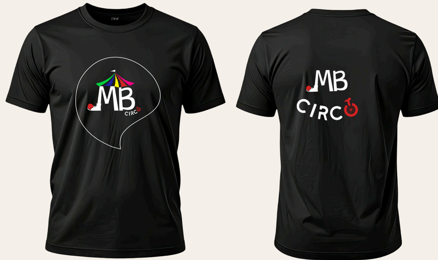
Aplicação frontal e dorsal no uniforme da equipe.