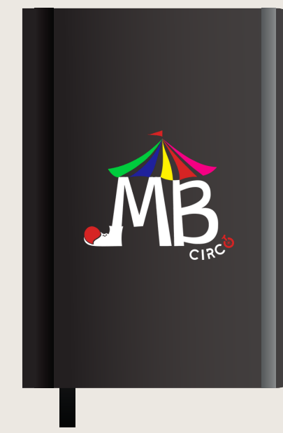
Caderno Uso institucional.