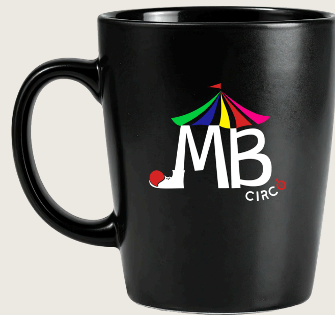
Caneca Uso institucional.