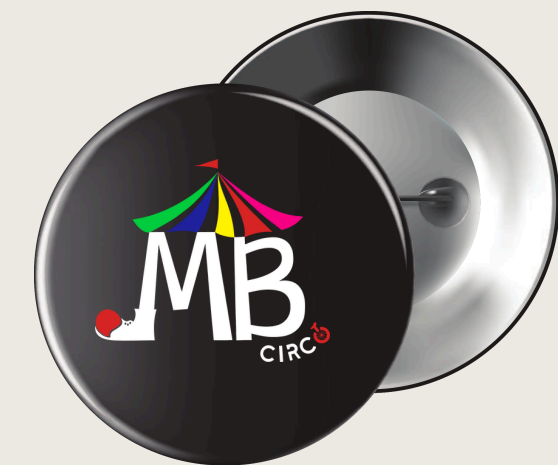
Botton Uso institucional.