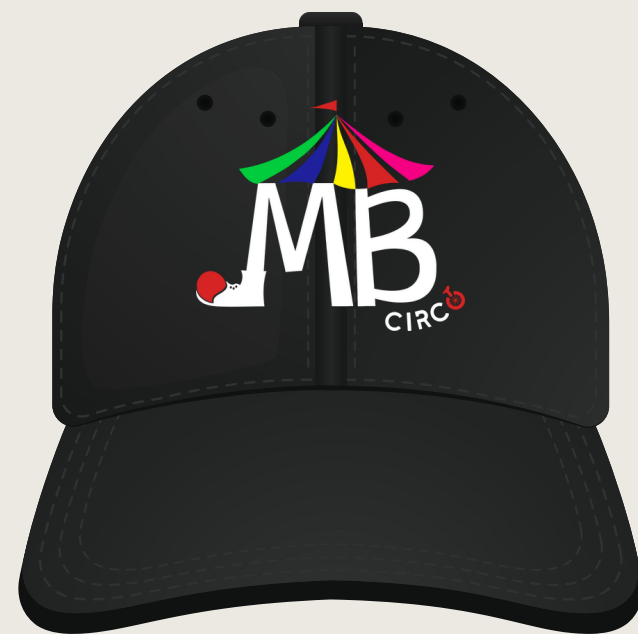
Boné Uso institucional.